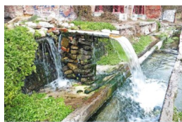
Возможно, удастся создать на территории складов небольшую, но действующую от родникового потока мельницу-макет, на которой можно будет смолоть горсть пшеницы, из которой тут же испекут лепешку. Напомним, что склады ранее были именно зерновыми, а местная мука славилась аж до Парижа.

Основную же часть строений придётся полностью восстанавливать, потому что того требует не очень совершенный регламент по памятникам культуры и потому что денег на обустройство Парамоновского комплекса потребуется очень много, а окупаемость затрат никто не отменял.