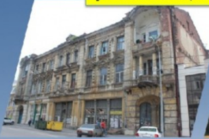
ул. Московская, 72