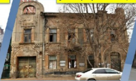
ул. Серафимовича, 95