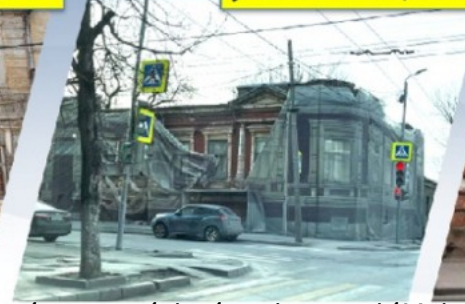
ул. 20-я линия, 11/22