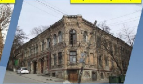
пер. Соборный, 8